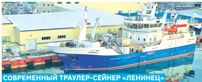
СОВРЕМЕННЫЙ ТРАУЛЕР-СЕЙНЕР «ЛЕНИНЕЦ»

Рыбная отрасль – основа краевой экономики, которая обеспечивает почти треть налоговых поступлений в бюджет региона, более 50 % объемов промышленного производства и 86 % экспортного потенциала. Это более 16 тысяч человек, занятых в отрасли, добывающих более 1 млн тонн рыбы в год, составляющего более трети всего улова России. И эти объемы могут быть значительно больше – спрос на дикую рыбу в стране и мире растет.