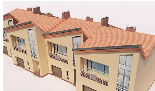
ПРОЕКТ ТАУНХАУСА НА 4 СЕМЬИ ДЛЯ МЛАДШЕГО ОФИЦЕРСКОГО СОСТАВА В ЖК «АВИАТОР» (ЕЛИЗОВО)