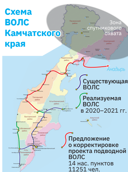
Схема ВОЛС Камчатского края